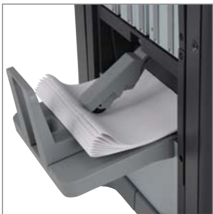
DOKONČOVACÍ ZAŘÍZENÍ, funkce booklet