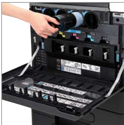
SNADNÝ PŘÍSTUP ke spotřebnímu materiálu